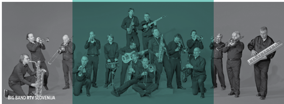
BIG BAND RTV SLOVENIJA

27 20.00 | SOBOTA / SUNDAY VIPAVA DVOREC LANTHIERI / LANTHIERI MANSION