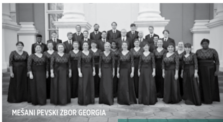
MEŠANI PEVSKI ZBOR GEORGIA

15 20.30 | PETEK / FRIDAY LJUBLJANA CERKEV SV. JAKOBA / ST. JAMES'S PARISH CHURCH