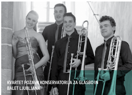
KVARTET POZAVN KONSERVATORIJA ZA GLASBO IN BALET LJUBLJANA