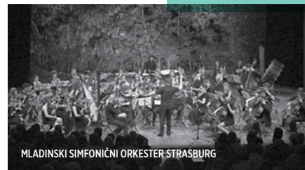
MLADINSKI SIMFONIČNI ORKESTER STRASBURG

26 20.30 | TOREK / TUESDAY LJUBLJANA ATRIJ ZRC / ATRIUM ZRC