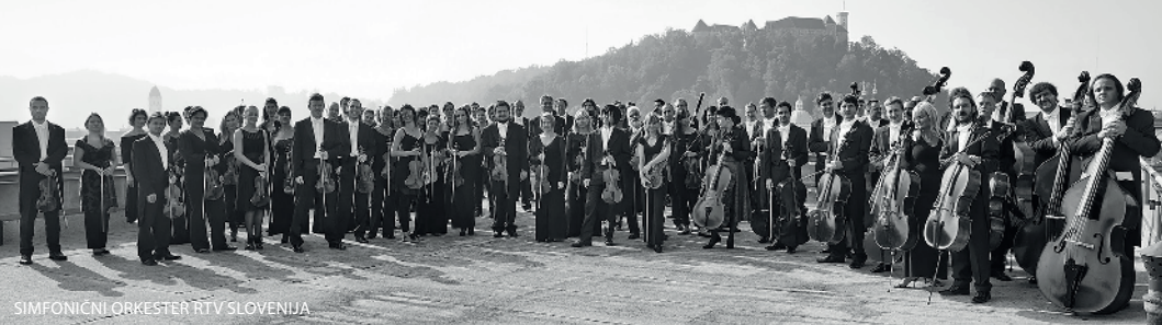
SIMFONICNI ORKESTER RTV SLOVENIJA