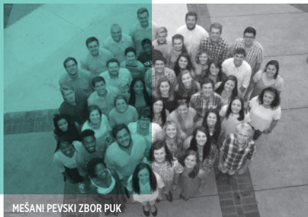
MEŠANI PEVSKI ZBOR PUK